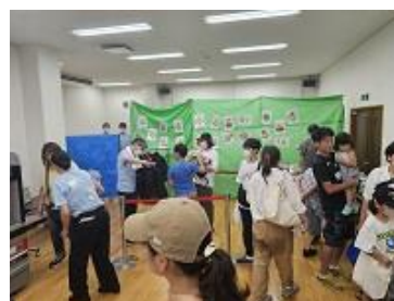
西館 2 階多目的室